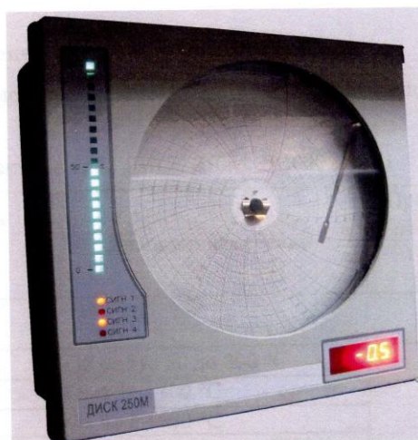
Рисунок 2 – Общий вид ДИСК250М, ДИСК 250М СТАЛЬ